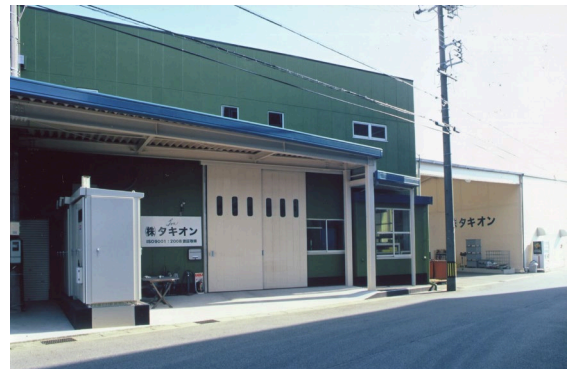
愛知県安城市にある本社工場

株式会社タキオンは、自動車部品の試作専門メーカーです。1979年に設立されて今年43年目を迎え、現在従業員は20名。「試作開発を全力で支援する会社」として、自動車部品メーカーの依頼に応じて設計から金型製造、試作までを短期間で行うことを強みとしています。なお、社名の「タキオン」は、超光速で動くと仮定されている粒子に由来しています。社名の通りのスピーディな試作対応で、顧客の「試作品をすぐに評価したい」というニーズに応えてきました。